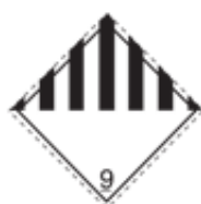
Forskjellige stoffer og gjenstander. Representerer andre farer enn de øvrige.