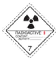
Radioaktivt stoff, emballasjemerking