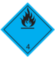
Fare for utvikling av brannfarlige gasser i kontakt med vann