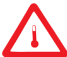
Merke for oppvarmede produkter