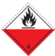
Fare for selvantennelse