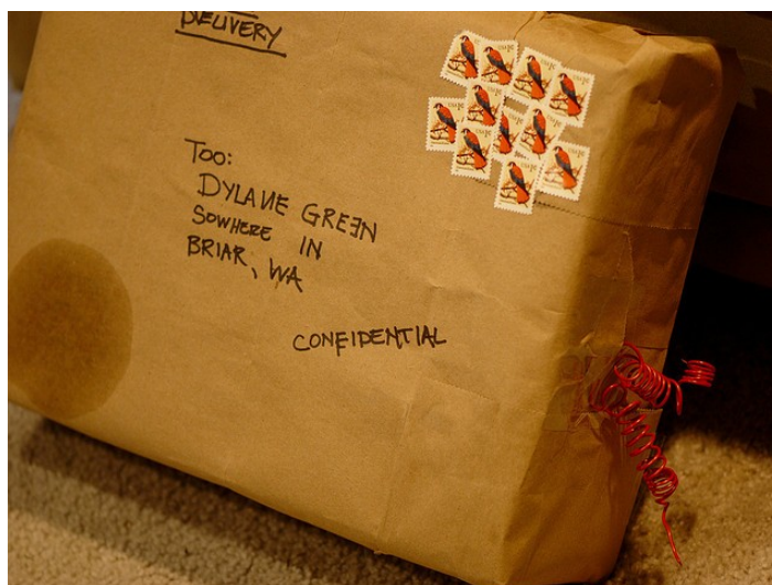
Illustrasjonsfoto: Eksempel på en mistenksom pakke